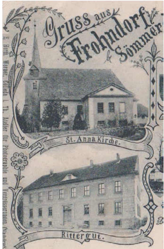
St. Anna-Kirche und Gutshaus in Frohdorf um 1900.