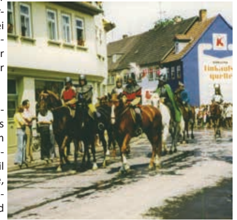
Impression vom Festumzug 1976 anlässlich 1100 Jahre urkundliche Ersterwähnung Sömmerda.

und Teilnehmer sind daher ausdrücklich willkommen.