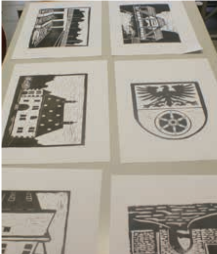
Linolschnitte von u. a. Sömmerdaer Sehenswürdigkeiten fertigten Schüler einer 9. Klasse der Gemeinschaftsschule „Albert Einstein“ an.

Über 600 Fotos, Bilder, Postkarten und Collagen haben Sömmerdas Bürgerinnen und Bürger, Schulen und Vereine bis Anfang März für die Mitmach-Ausstellung des Historisch-Technischen Museums anlässlich des 1150-jährigen Stadtjubiläums eingereicht. Gesucht waren Bilder, die einen ganz persönlichen Blick auf Sömmerda und