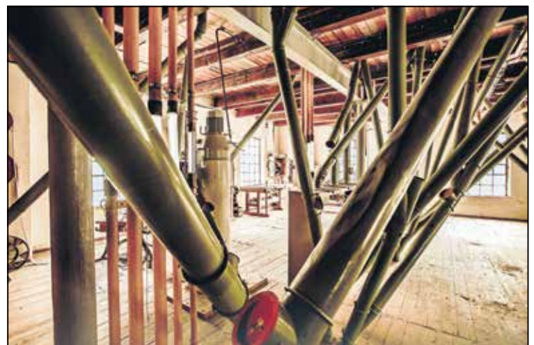
Auch dieser gehört zu den geheimen Orten. Wo könnte das sein?

Ebenso wird auf der Hauptbühne das Geheimnis gelüftet, mit welchem Slogan die Stadt für den Thuringentag 2019 in Sömmerda wirbt. Die Gewinnerin bzw. der Gewinner aus den eingegangenen Vorschlägen wird zur SÖM prämiert.