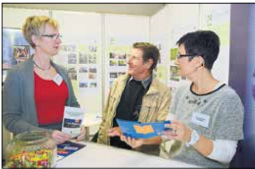
Mitglieder des Fördervereins der Stadt- und Kreismusikschule werden zur SÖM 2017 über ihr ehrenamtliches Engagement informieren.

Deswegen ein herzliches Dankeschön an alle Freunde und Förderer der Musikschule. Lassen Sie sich am Stand des Fördervereins informieren und kommen Sie mit Aktiven des Fördervereins ins Gespräch.