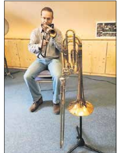
Eine Bassposaune im Vergleich mit der Zugtrompete.

Lehrer und Schüler freuen sich über die Bereicherung und somit über einen wichtigen Baustein der musikalischen Ausbildung.