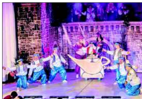
Natürlich wieder mit dabei, wie auch hier 2016, ist das FCR-Männerballett.

Auf ein stimmungsvolles Programm im Volkshaus Sömmerda können sich die Gäste des FCR schon jetzt freuen.