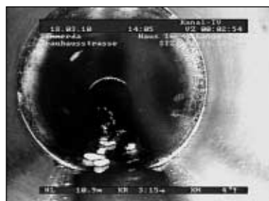
Unerlaubte Abfallentsorgung über die Kanalisation: Speisereste (hier: Pommes Frites) - Beste Bedingungen für Wanderratten