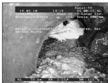
"Auge in Auge" mit der Kanalkamera: Die Ratte

Unbestritten zählen die behaarten Nager namens Wanderratten wohl zu der Besuchergruppe, die wir weder auf unserem Grund und Boden, noch in den eigenen vier Wänden sehen oder empfangen möchten. Und dennoch: Nachtaktiv und tagsüber gut versteckt scheinen sie uns im Alltag ständig zu begleiten, denn auch in Sömmerda belagern sie trotz Bekämpfung die Abwasserkanäle.