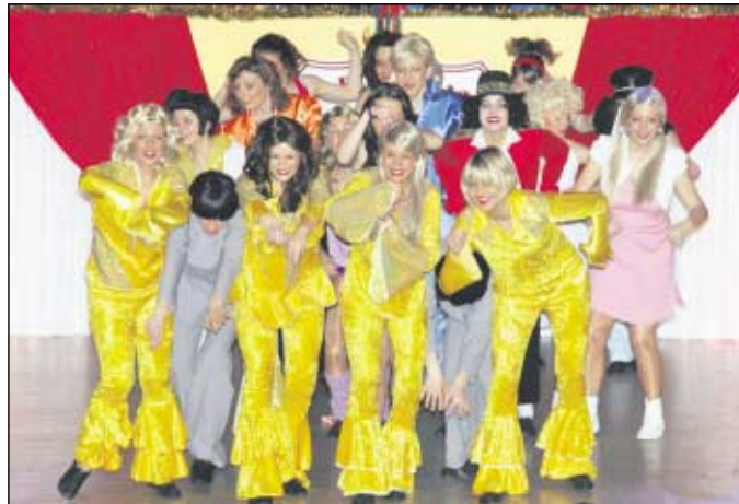
Wieder mit dabei: Die Showtanzgruppe des TSV Sömmerda

Unter dem Motto “Was die Welt zusammenhält, ist der Humor und nicht das Geld” veranstaltet der Faschingsclub Rot-Weiß Sömmerda e. V. erstmals einen bunten Kostümball. Mit diesem Kostümball startet der FCR in die närrischen Tage 2011. Erleben werden die Gäste ein neues unterhaltsames Faschingsprogramm mit einigen Überraschungen.