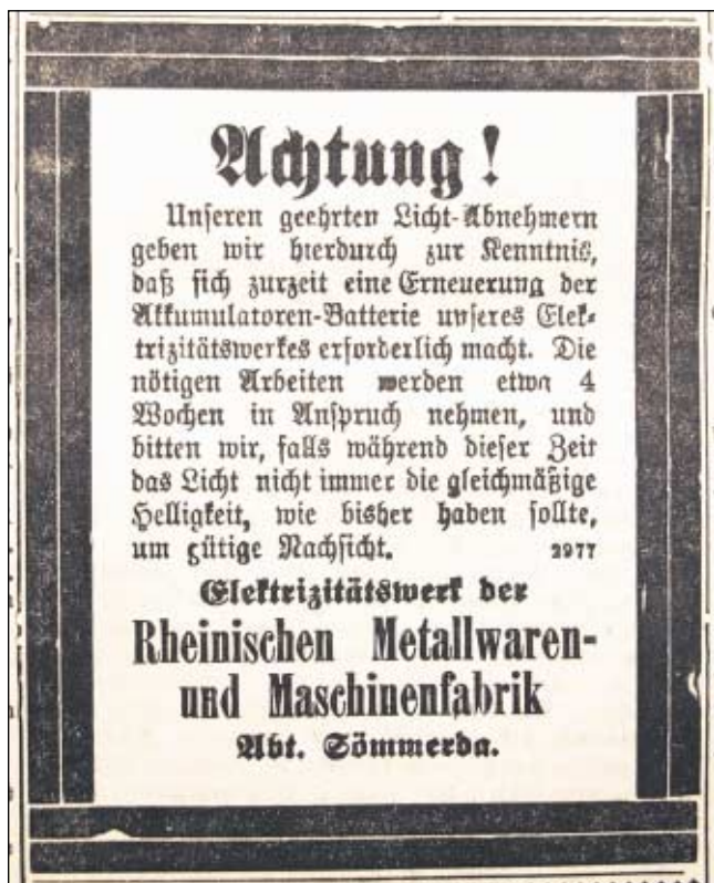
Anzeige Sömmerdaer Zeitung vom Sonntag, 06. November 1910

Der Ausschuß der Deutschen Turnerschaft erlässt an alle Turnvereine eine amtliche Bekanntmachung, wonach die Zulassung der Zöglinge zu Ballvergnügen zu unterbleiben hat. Die Jugend bis zum vollendeten 17. Lebensjahre sind andere Unterhaltung, - vor allem Belehrungen, Spiele, Wanderungen und sonstige Betreuungen - zu bieten, nicht aber Tanz. Für die Durchführung dieser Maßnahme sind die Vereinsvorstände in erster Linie verantwortlich.