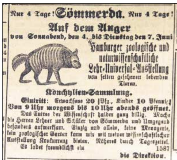
Anzeige Sömmerdaer Zeitung vom Freitag, 03. Juni 1910

Engerlingsplage: Aus landwirtschaftlichen Kreisen wird verlautet, daß in diesem Jahre die Engerlinge in großer Zahl auftreten. Es dürfte sich deshalb empfehlen, auf die Vernichtung dieses Schädling ganz besonders bedacht zu sein.