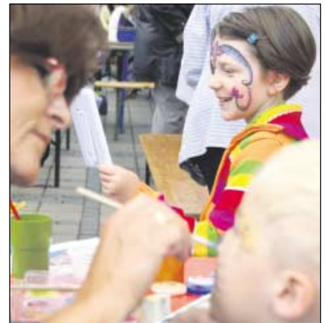
Neben den Angeboten der Vereine des Bürgerzentrums beteiligte sich auch die Ludothek mit Kinderschminken am Fest.