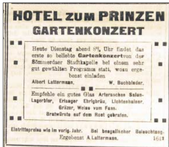
Anzeige Sömmerdaer Zeitung vom Dienstag, 07. Juni 1910

Bekanntmachung: In Schallenburg ist eine Telegrafenanstalt mit öffentlicher Fernsprechstelle eingerichtet worden, die auch den Unfallmeldedienst wahrnimmt.