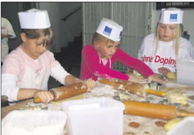
Großen Zuspruch hatte auch in diesem Jahr die Filiale der Frische Bäcker Süpke & Hoschkara mit ihrer Kinderbackstube. Zahlreiche Plätzchen wurden gebacken, verziert und genascht.