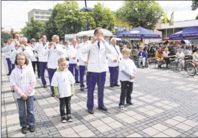
Eröffnet wurde das Wohngebietsfest in diesem Jahr vom Spielmannszug aus Schloßvippach, der den Sömmerdaern bereits vom Ernteumzug und Bauernmarkt bekannt ist.

Auch in diesem Jahr war das Wohngebietsfest auf dem Böblinger Platz am 20. Juni 2010 willkommener Anlass für einen gemütlichen und unterhaltsamen Nachmittag für zahlreiche Familien und Anwohner aus der "Neuen Zeit" sowie Besucher und Gäste. Ein geladen dazu hatten die Stadtverwaltung, die beiden Wohnungsunternehmen WGS und WOBAG sowie die Vereine des Bürgerzentrums "Bertha von Suttner". Ein Dank an dieser Stelle geht an alle Beteiligten, vor allem dabei an alle Kollegen und Helfer hinter den Kulissen, die diese Veranstaltung mit abgesichert und so überhaupt erst möglich gemacht haben.