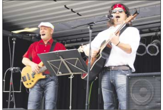
Mit Stimmungsmusik und witzigen Einlagen begeisterten von der Show-Truckbühne die Jungs der Gruppe "Die 3 lustigen 4" die kleinen und großen Besucher an diesem Nachmittag.