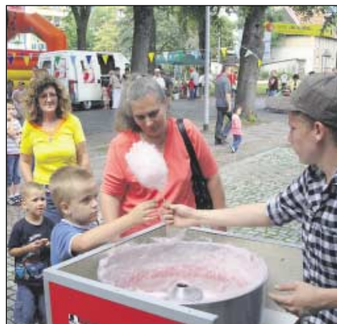
Zuckerwatte: Ein regelrechter Ansturm der Besucher herrschte an diesem Tag am Zuckerwattestand.