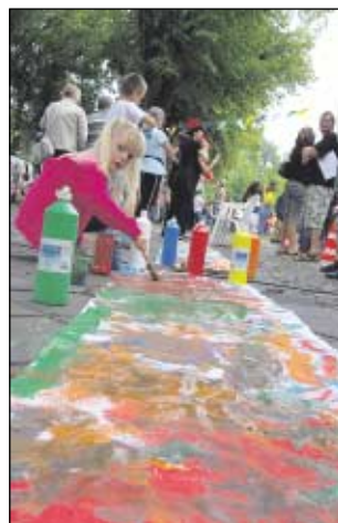
Malstraße: Vor allem die kleinen Gäste entdeckten die Malstraße für sich.