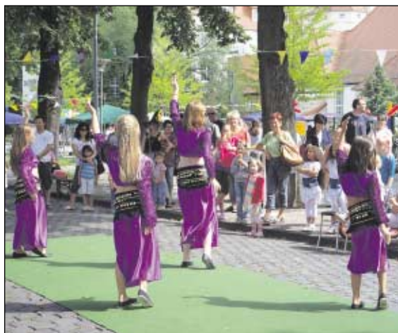
Little Suleika: Den roten Faden des Straßenfestes bildeten verschiedene Bühnenauftritte, unter anderem auch ein orientalischer Tanz der Little Suleikas.