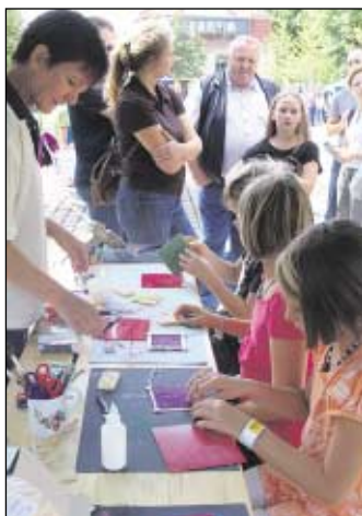
Basteln: Für die kleinen und großen Künstler gab es außerdem eine Bastelstation.