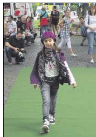
Modenschau: Viele Blicke erhaschten die Models, die Mode von Takko vorführten.