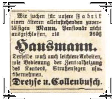
Anzeige vom 15. Oktober 1908