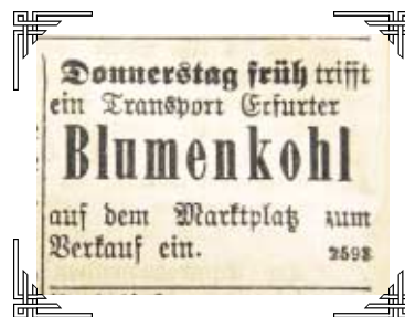
Anzeige vom 15. Oktober 1908