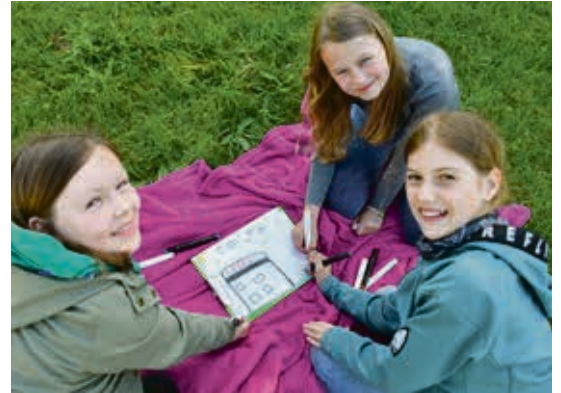
Erste Vorstellungen, wie die Kinderstadt einmal aussehen könnte, wurden von den anwesenden Kindern aufs Papier gebracht. Die Motive schmücken später den Bauzaun.

Ebenso hoffen ASB und KJP vor allem während der „Bauphase“ auf dem Bauspielplatz auf ehrenamtliche Unterstützung für die Kinder durch beispielsweise handwerklich begabte Senioren. Ein entsprechender Aufruf soll rechtzeitig erfolgen.